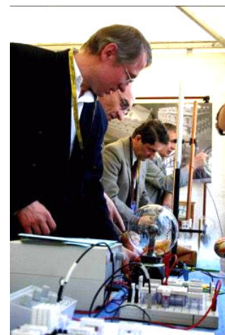
Pokazy fizyczne (Festyn Nauki 2006)