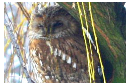
Sowa w parku okalającym Królewski Pałac w Łobzowie (XIV w). W tym pałacu ma swoją siedzibę Instytut Fizyki oraz Dziekanat WFMiIS PK.

Studia zostaną uruchomione, jeżeli zostanie przyjętych co najmniej 25 osób.