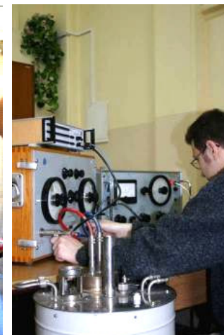
Pracownia aparaturowa (Instytut Fizyki WFMiIS)